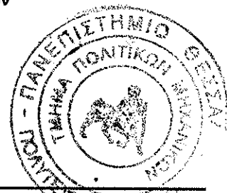
Καθηγητής Ευριπίδης Μυστακίδης

Ο Προέδρος του Τμήματος Πολιτικών Μηχανικών